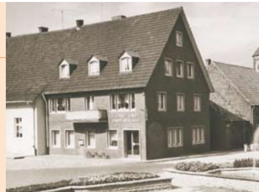
Das erste eigene Haus am Burgplatz diente der Kreditgenossenschaft in der Zeit von 1958 bis 1969.