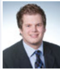
Marc Roling Bausparkasse Schwäbisch Hall